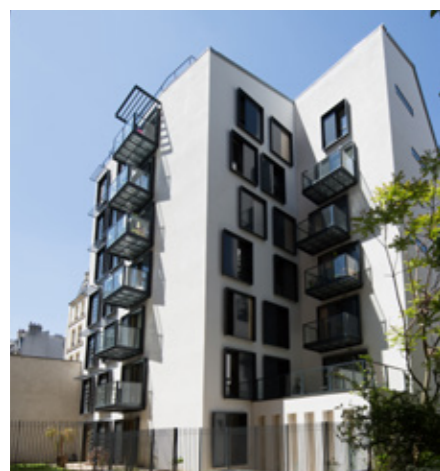
17 logements, rue de Charonne, Paris 11.