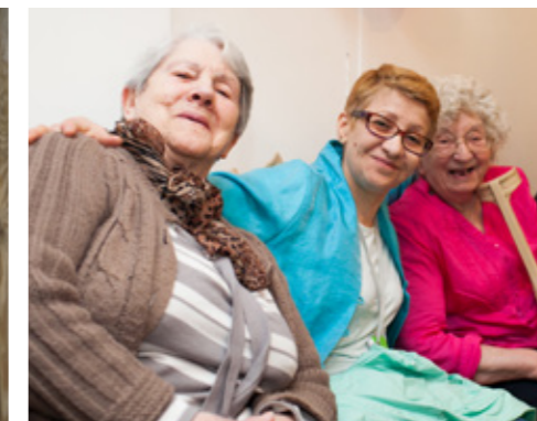
Accompagnement des personnes âgées pendant les travaux de réhabilitation.