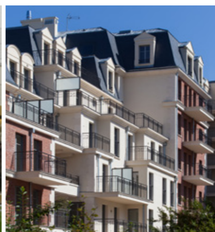
Renouvellement urbain : 300 logements à La Garenne-Colombes.

Agence takecare • 458 • © Sergio Grazia, Augusto Da Silva, Ivan Mathie, Thibault Robert, Fabrice Dusapin, Curry Vavart.