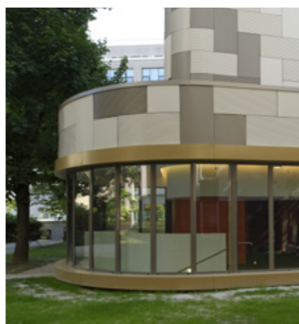
Réhabilitation thermique : consommation divisée par 3, rue du Chevaleret, Paris 13.