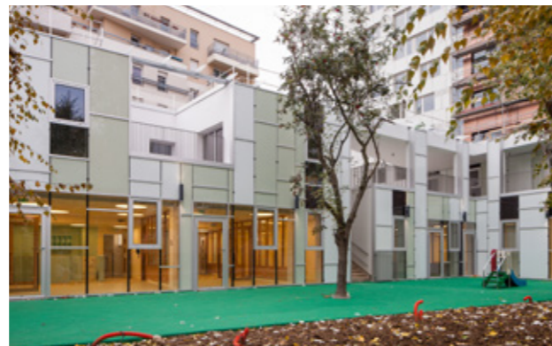
Crèche de 60 berceaux, rue de Charolais, Paris 12.