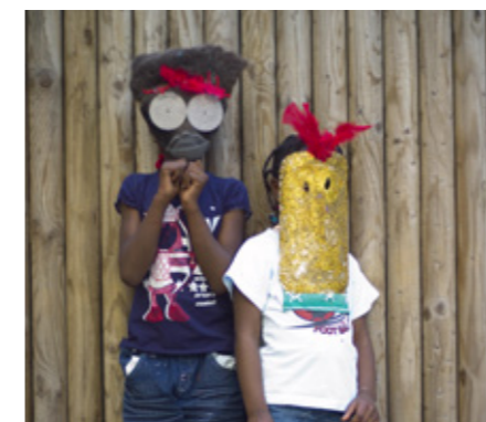
Soutien aux associations de locataires.

Pour ICF Habitat La Sablière, la satisfaction des locataires passe par une bonne gestion de ses résidences et l'amélioration constante du service proposé, mais aussi par la dynamisation du lien social. Les chargés de développement social favorisent ainsi l'engagement des habitants dans la vie de leur résidence et de leur quartier, ainsi que l'implantation et le développement des associations locales.