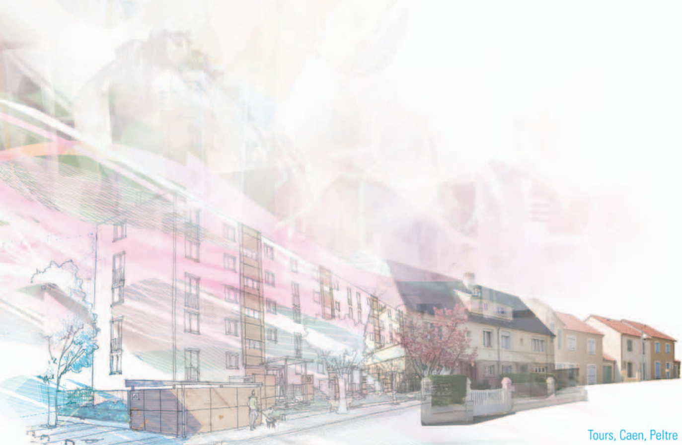
Tours, Caen, Peltre

350 collaborateurs au service de nos clients