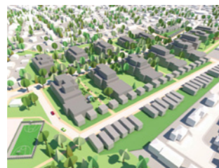
▲ Cité cheminote Brou-sur-Chantereine - Chelles Un projet urbain pour améliorer les circulations, apporter des services, réduire l'empreinte écologique avec la réhabilitation de 526 pavillons de la cité-jardin et créer une nouvelle offre de 526 nouveaux logements.