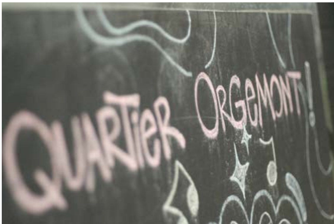
On pourrait comparer Orgemont à une ruche de talents.