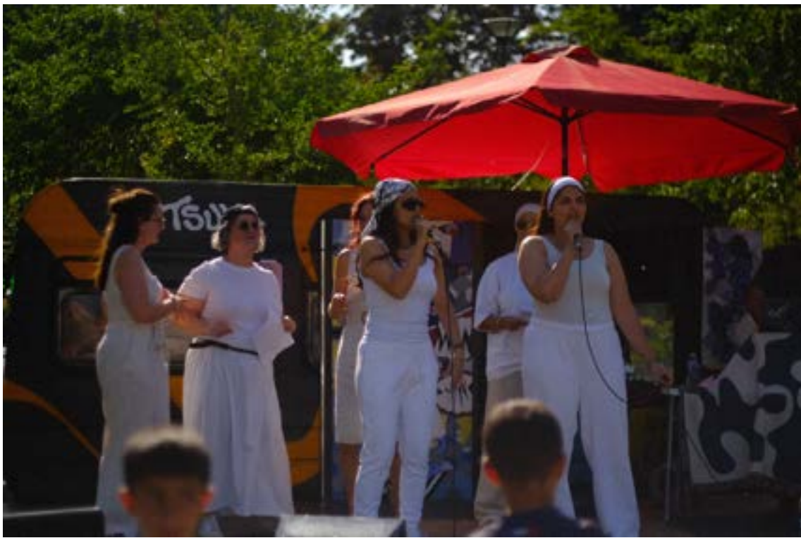
L'équipe de la maison de quartier monte sur scène pour interpréter "Loin de tout ça".