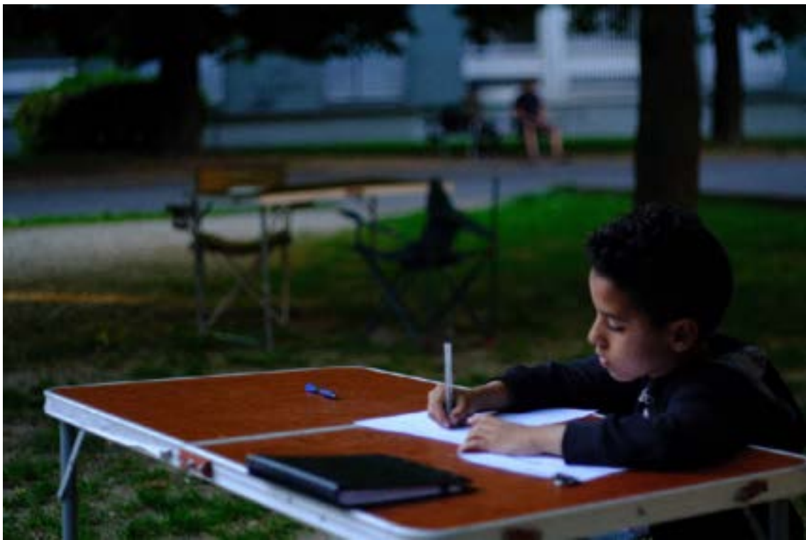
En pleine inspiration...