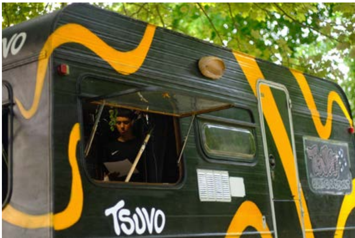
Mohammed révisé son texte avant d'enregistrer