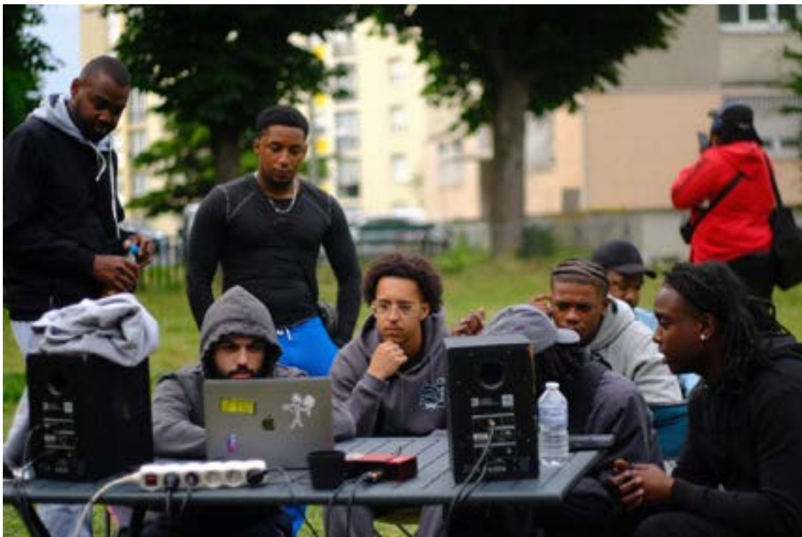
L'artiste "L'abeille" compose un morceau collectif aux sonorités "Bouyon".