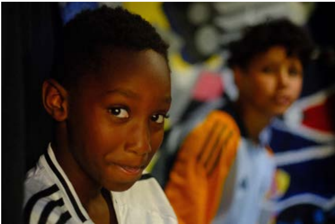
Deux jeunes curieux venus s'essayer à la musique.