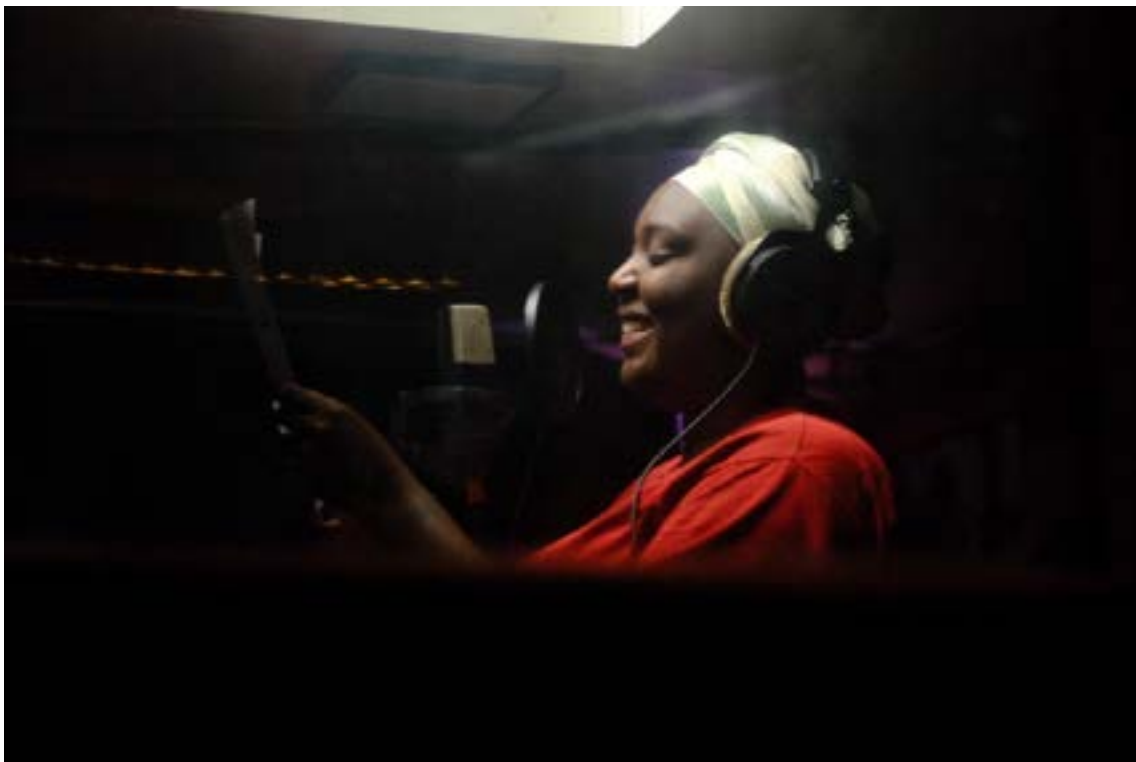
Gitrōina s'essaye au rap pour la première fois en cabine avec un texte politique et personnel.