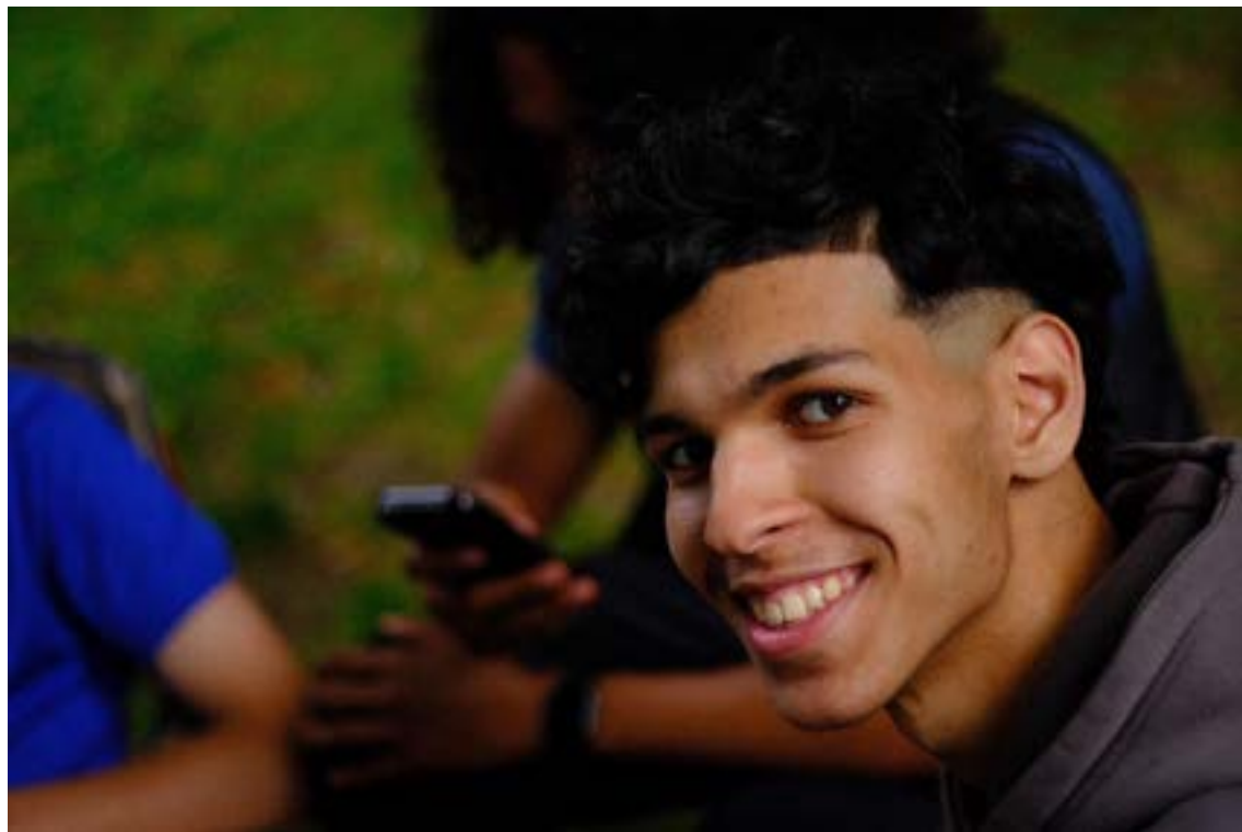
Des jeunes gravitent quotidiennement autour de la caravane.