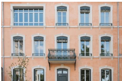
Ravalement à l'enduit de chaux aérienne