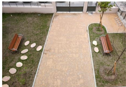
Extérieur engazonné avec plantations, bancs, pas japonais et abri à vélos