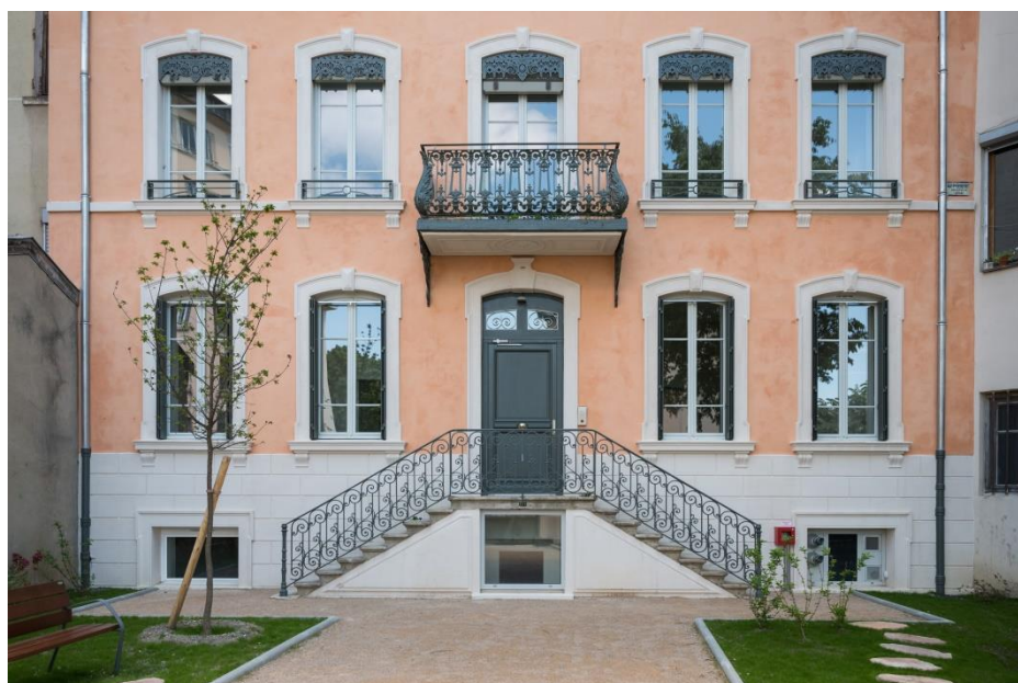
Maison Roussy en 2021