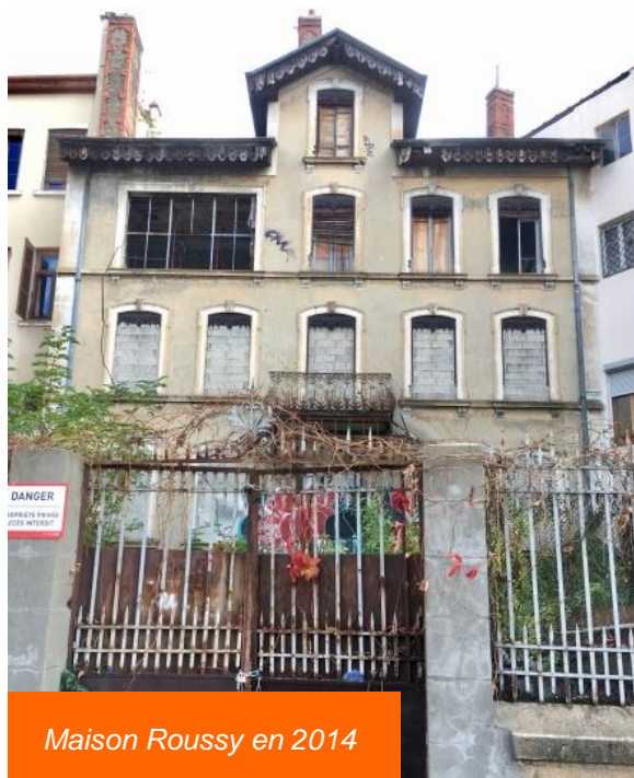
Maison Roussy en 2014

Construite en 1895 sur trois niveaux par l'architecte G. François Ferrant, cette demeure a connu de nombreux aléas par le passé (squats, incendie) avant l'acquisition par ICF Habitat Sud-Est Méditerranée qui a entrepris une restructuration totale de cet hôtel particulier en lien avec les architectes des Bâtiments de France (ABF) et le cabinet Axe Architecture. Ce travail de restructuration a permis de réaliser des logements neufs tout en conservant la façade existante.