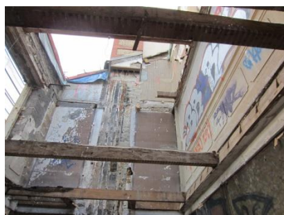
Curage et démolition des éléments de structure intérieurs (planchers, murs de refend), avec confortement de l'existant Remplacement des planchers et escalier bois par des planchers et escalier en béton armé