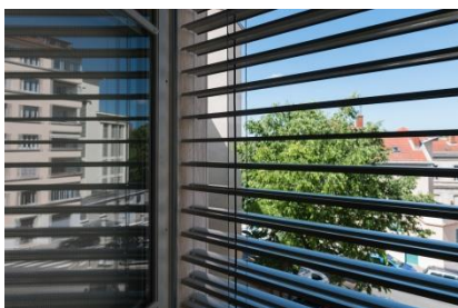
Menuiseries extérieures en bois avec jalousies à lames empilables et orientables en aluminium laqué