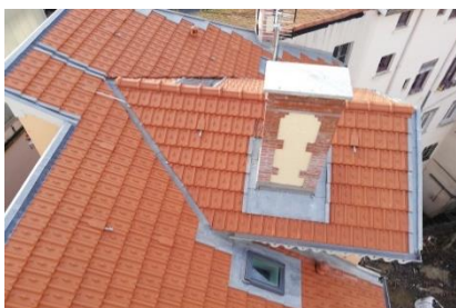
Réfection des souches de cheminée ou démolition et reconstruction à l'identique