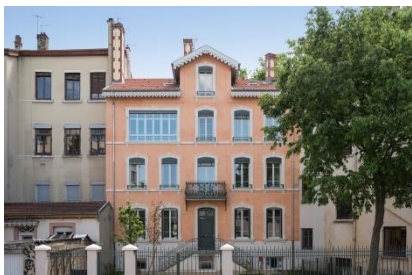
Mise en peinture des lambrequins existants

Un travail important de réhabilitation de la façade a été mené pour révéler cette bâtisse ainsi qu'un aménagement des espaces extérieurs. Des interventions méticuleuses ont été effectuées par des entreprises spécialisées sur l'enveloppe du bâtiment avec l'utilisation de techniques et matériaux spécifiques.