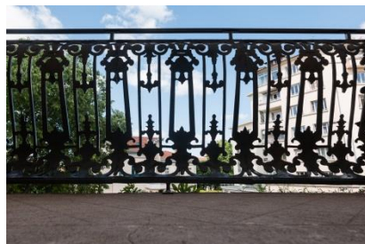
Remplacement garde-corps, balcon, en fonte d'aluminium, réutilisation des pièces d'angles