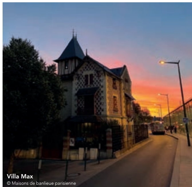
Villa Max