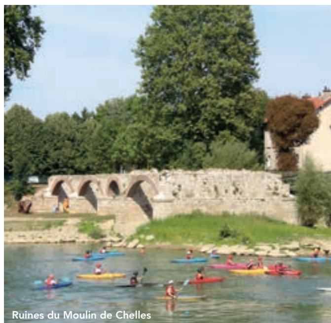
Ruines du Moulin de Chelles