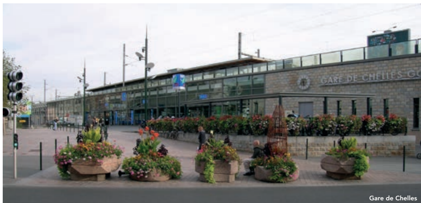
Gare de Chelles