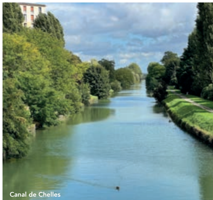
Canal de Chelles