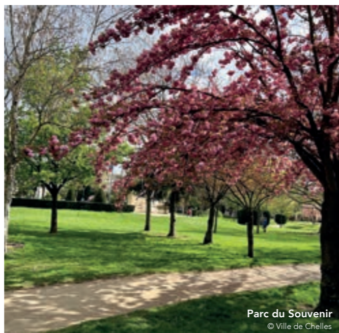
Parc du Souvenir