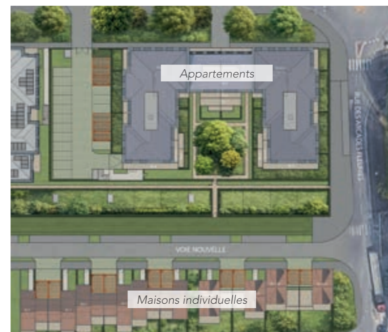
Plan masse du projet

Voir l'implantation du projet dans son éco-quartier