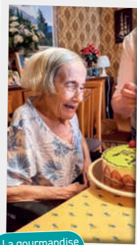
La gourmandise n'a pas d'âge !

Création : c.p.s. Droits réservés. Ne pas jeter sur la voie publique. JANVIER 2022.