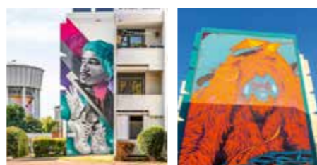
MisterCopy au 56 avenue du Président Wilson

À l'occasion du Street Art festival de Calais, des artistes reconnus ont égayé les murs de résidences d'ICF Habitat Nord-Est. N'hésitez pas à venir découvrir ces œuvres aux adresses ci-dessous.