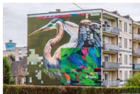
Palval au 12 rue Henri Lefebvre